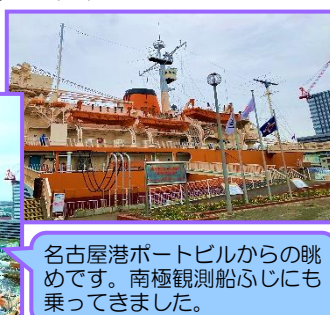
名古屋港ポートビルからの眺めです。南極観測船ふじにも乗ってきました。